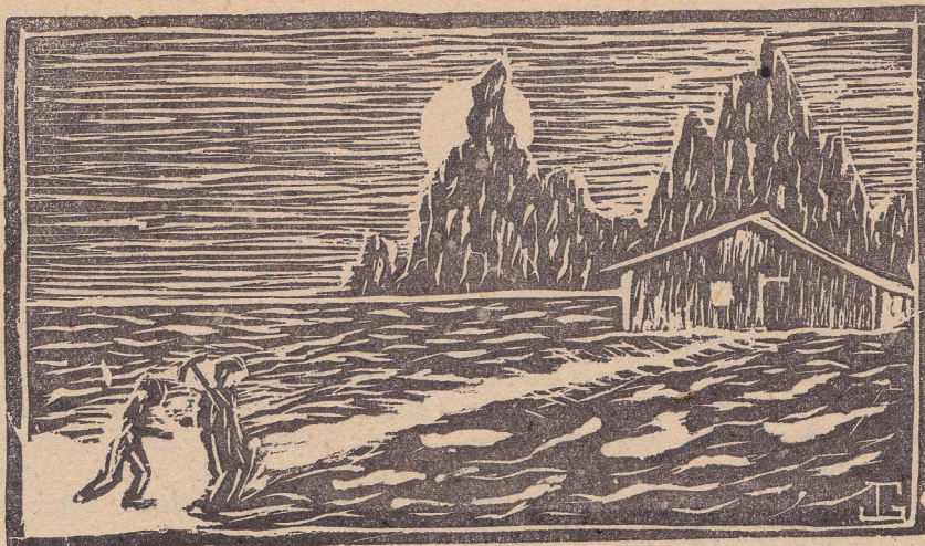
Linóleo de Jorge Gjuranovic. — V Año.