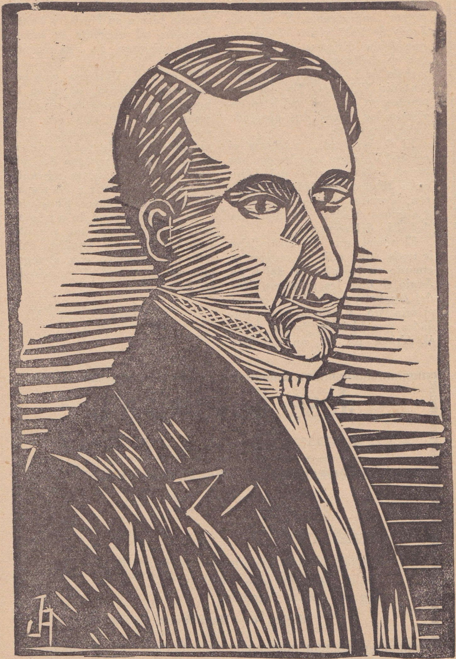
Don Diego Portales. — Linóleo de Juan Adema.