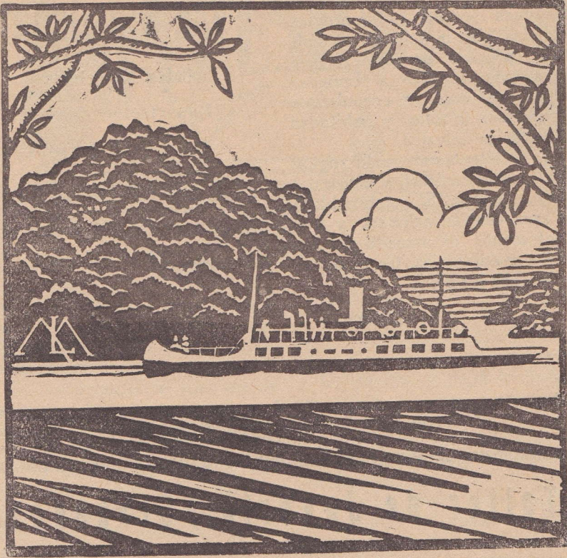
Linóleo de Mirko Litrica. V Año.