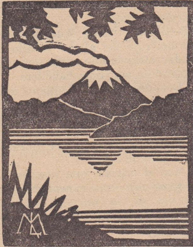
Linóleo de M. Litrica. — V. Año.