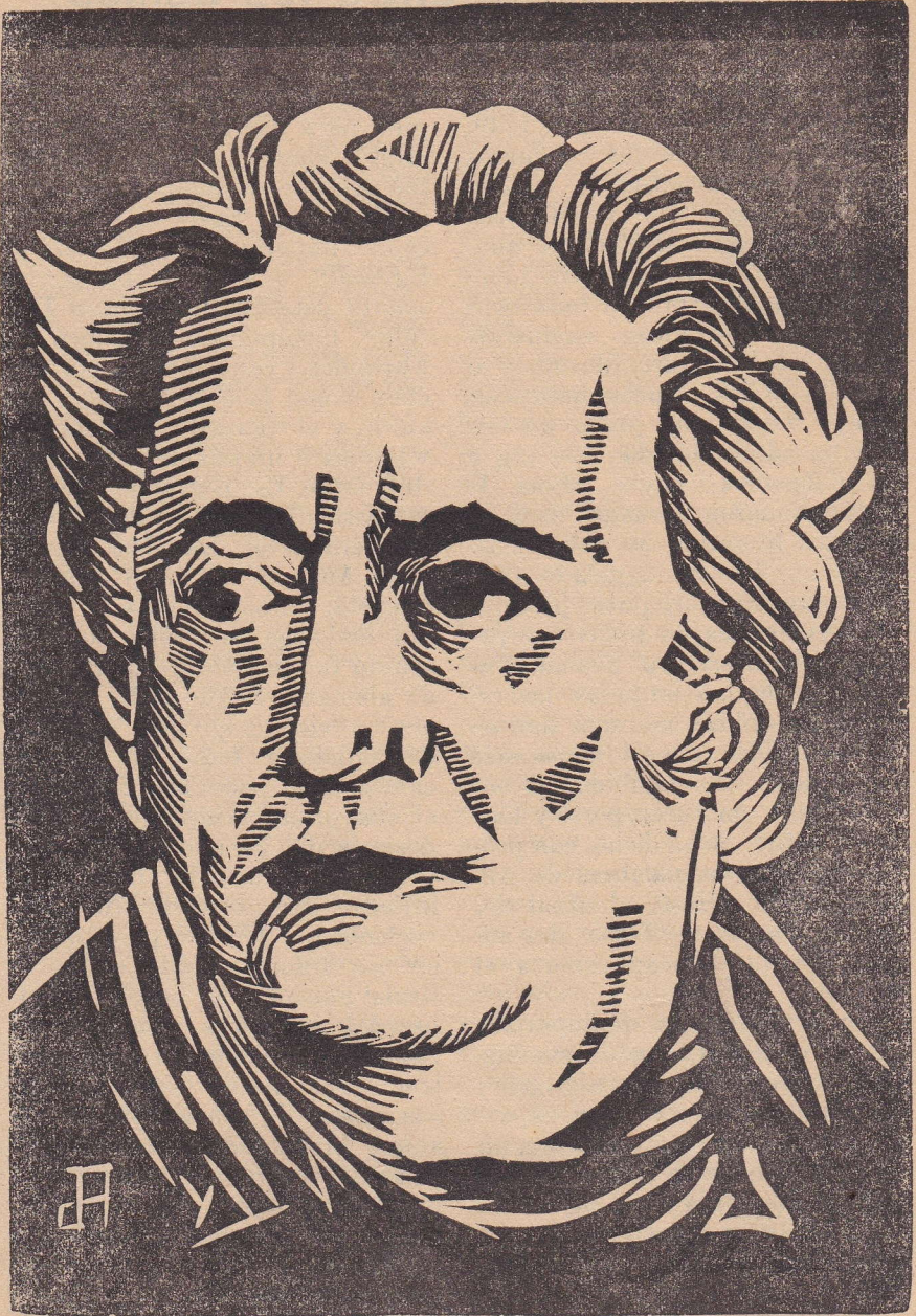
GOETHE. — Linóleo de Juan Adema. — VI Año.