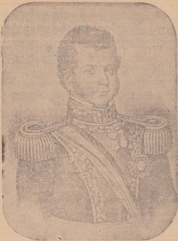
DON BERNARDO O'HIGGINS

Pabres de la Patria llama el pueblo chileno, a O'Higgins, San Martín, Rodríguez, los Carreras, y a otros que, como ellos, ofrecieron el sacrificio de sus vidas por libertarnos.