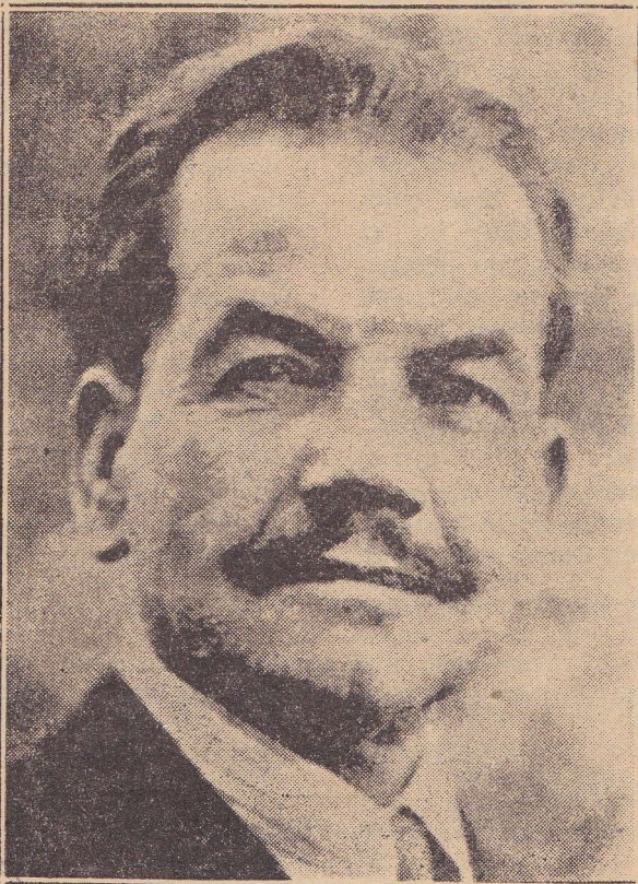
S. E. don Pedro Aguirre Cerda